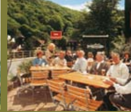
Das Restaurant »Forelle« & seine bekannten Spezialitäten