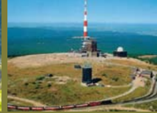
Der hauseigene Reisedienst für erlebnisreiche Tage